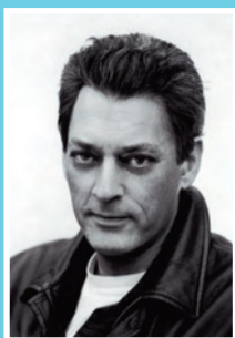
PAUL AUSTER PRESIDENTE

Autor de libros como "Brooklyn Follies"; "El cuaderno rojo"; "Tom-buctú"; "Ciudad de cristal"; "Ghosts" o "La habitación cerrada", este escritor estadounidense ha desarrollado una intensa actividad cinematográfica. En esta edición, fuera de concurso, se proyecta su última película, La vida privada de Martin Frost . Es también autor del guión de Smoke y de Blue in the Face , cinta codirigida con Wayne Wang. Miembro de la American Academy of Arts and Letters y Commandeur de l'Ordre des Arts et des Lettres de Francia, cuenta, entre otros, con el Premio Príncipe de Asturias de las Letras, el Prix Médicis a la mejor novela extranjera publicada en Francia, el Oso de Plata del Festival de Berlín y el Independent Spirit Award al mejor guión.