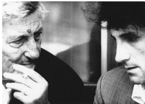
Fotograma de Les baisers de secours .