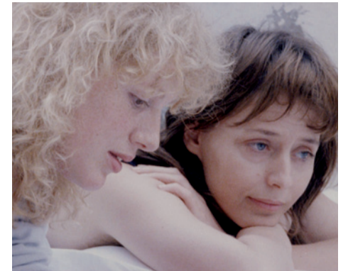
Escena de la película J'entends plus la guitare .

De todo ello vuelve a hablar esta película sobre la que planea siempre, aunque no se cite expresamente, la figura recurrente de Nico, que había fallecido en Ibiza casi al mismo tiempo que Garrel rodaba su anterior largometraje, Les Baisers de secours , con el que comparte, más que con cualquier otro, ese permanente juego de espejos entre los personajes de la ficción y las figuras reales que pueblan el mundo del cineasta (esposas, compañeras perdidas, padres, hijos, amigos). No es de extrañar que tras la muerte de Nico, Garrel tardara tres años en hacer otra película, y que ésta sea la evocación, más disimulada o más idealizada, de la relación que mantuvo con la actriz, modelo y cantante, eje vertebral de buena parte de su obra. Como ya había ocurrido con Les Baisers de secours , Garrel escribió el guión en solitario pero dejó que fuera el escritor