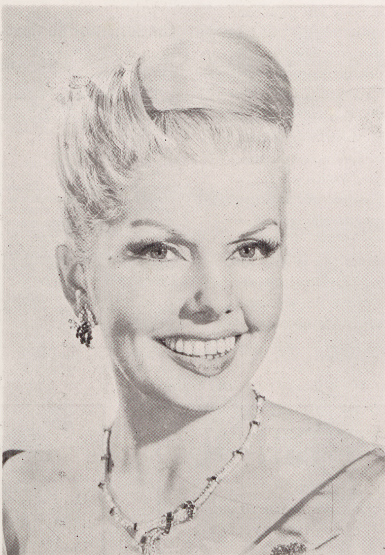
Maria Martin se asoma a nuestro Festival. La belleza rubia y elegante de Maria Martin no podía faltar en el Certamen. Maria Martin acaba de terminar "Un bruto para Patricia", producción en eastmancolor, P. C. Brío, que, dirigida por León Klimovsky, será presentada en España por la firma distribuidora Mundial Flims.