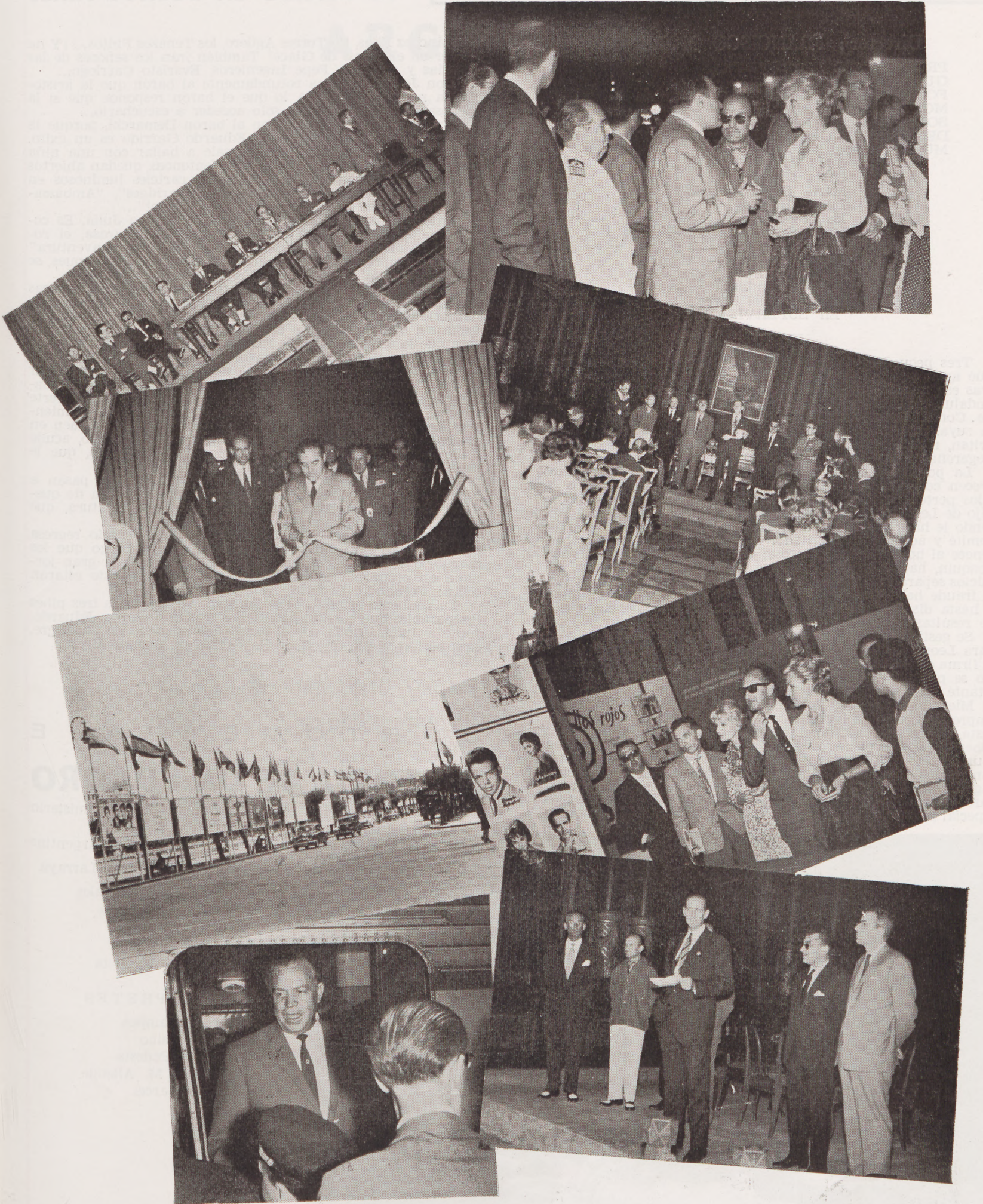
Información gráfica : AYGÜES Y APARICIO