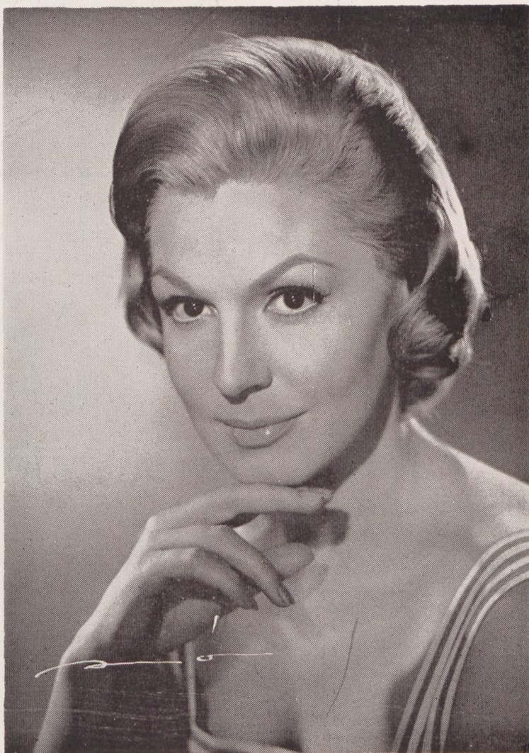
Zully Moreno, la eminente actriz miembro del Jurado "Perla del Cantábrico", para películas realizadas en lengua española, en el VIII Festival Internacional de San Sebastián, que ha instituido un "Premio para la actriz o actor que constituya una auténtica revelación cinematográfica en el Certamen", también para artistas del mismo idioma