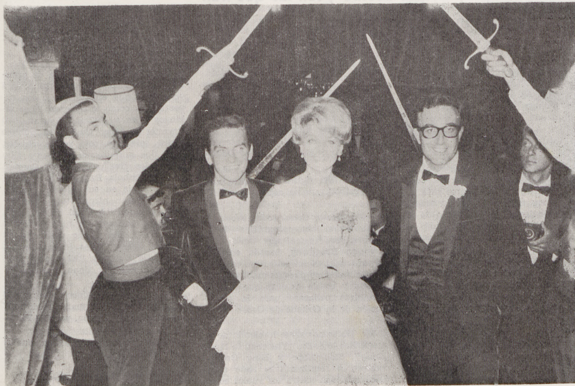
Las estrellas inglesas Dany Robin, Peter Sellers y Jhon Fraser, a su entrada al Palacio del Festival.