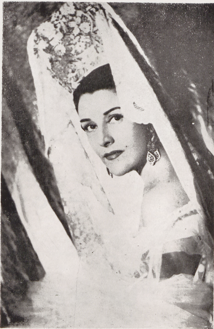
La personalidad femenina más trascendental en el cine español esta pre ente en San Sebastián para recibir el homenaje que su arte inigualable reclama por derecho propio.