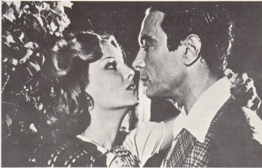
“Boquitas pintadas”, basada en la obra de Manuel Puig