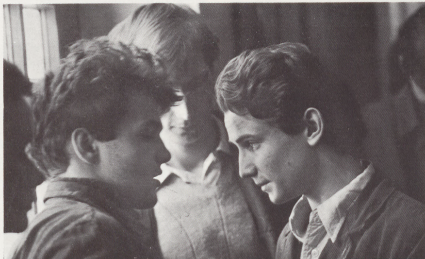
Foto de la película "Megall az idó", que será presentada hoy por Hungría en la Sección Oficial

Nació en 1947. Desde 1968 colabora como ayudante de dirección para la televisión húngara. Tres años más tarde comienza sus estudios en la Escuela Superior de Teatro y Cine de Budapest. En 1975 comienza a trabajar como realizador de documentales dramáticos y películas para niños en la televisión húngara. Paralelamente dirige obras de teatro desde 1978. Con "Ajandék ez a nap" obtuvo en Venecia el "León de Oro" en 1980.