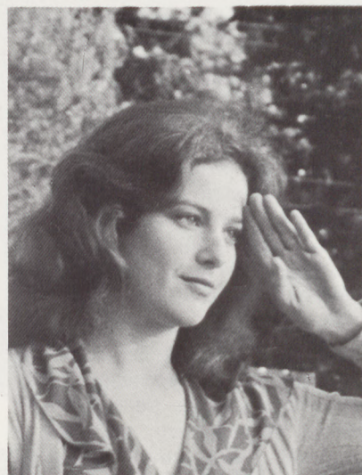
A Paramount Picture AN OFFICIER AND A GENTLEMAN Presentada por EE.UU.

Debutó en el cine con "The idol-maker". Durante los años 70 trabajó como presentador de actuaciones de rock en la televisión. "An officier and a gentleman" es su segundo largometraje.