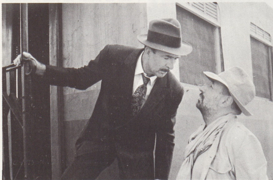
Philippe Noiret, a la derecha.

El director Bertrand Tavernier nació en Lyon en 1941. Cursó estudios de Derecho alternando con trabajos de crítica cinematográfica en revistas especializadas como "Cahiers du Cinéma" y "Telerama". Colabora también como guionista en obras de diferentes realizadores. Trabajó también en la Cinemateca Nickelodeon, rescatando títulos del cine mudo americano. A partir de 1963 se dedica a la realización siendo su primera película "Baiser de Judas". Le siguen obras tan importantes como "El relojero de Saint Paul", "Que la fiesta comience", "La muerte en directo" y "Una semana de vacaciones".