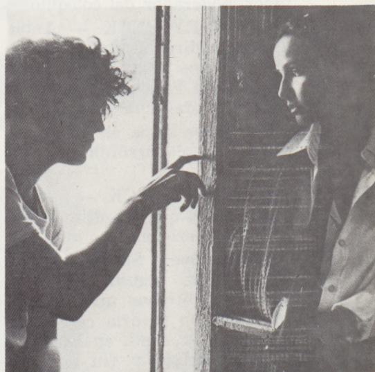
Fotograma de "Nasednitsa po pria moi".

El director, Sergei Soloviev, nació en 1944. En 1969 se graduó en el Instituto Cinematográfico de Moscú. Actualmente trabaja en los estudios Mosfilm. Ha dirigido dos largometrajes: "100 días después de la infancia" y "Salvador".