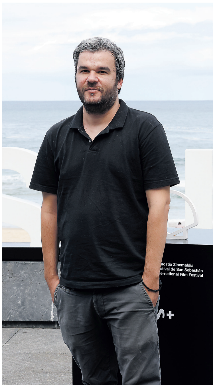
Christos Nikou bere bigarren film luzea aurkezten.

Eta ondorioz, filmean lortu nahi zuen tonuaz aktoreekin luze hitz egin zuela gaineratu du. "Ez zait gustatzen tonu bakarreko lanak egitea, zinemak komedia, drama eta erromantizismo apur bat izatea nahi dut, bizitzan gertatzen den bezala", esanez amaitu du.