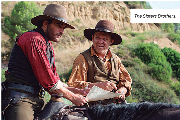
The Sisters Brothers.