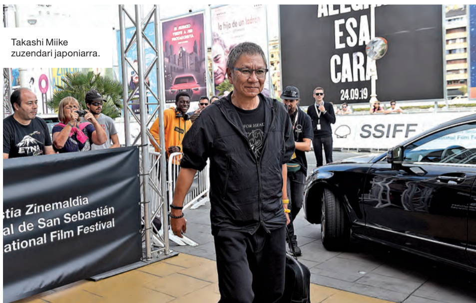
Takashi Miike zuzendari japoniarra.