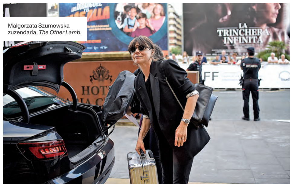
Malgorzata Szumowska zuzendaria, The Other Lamb .