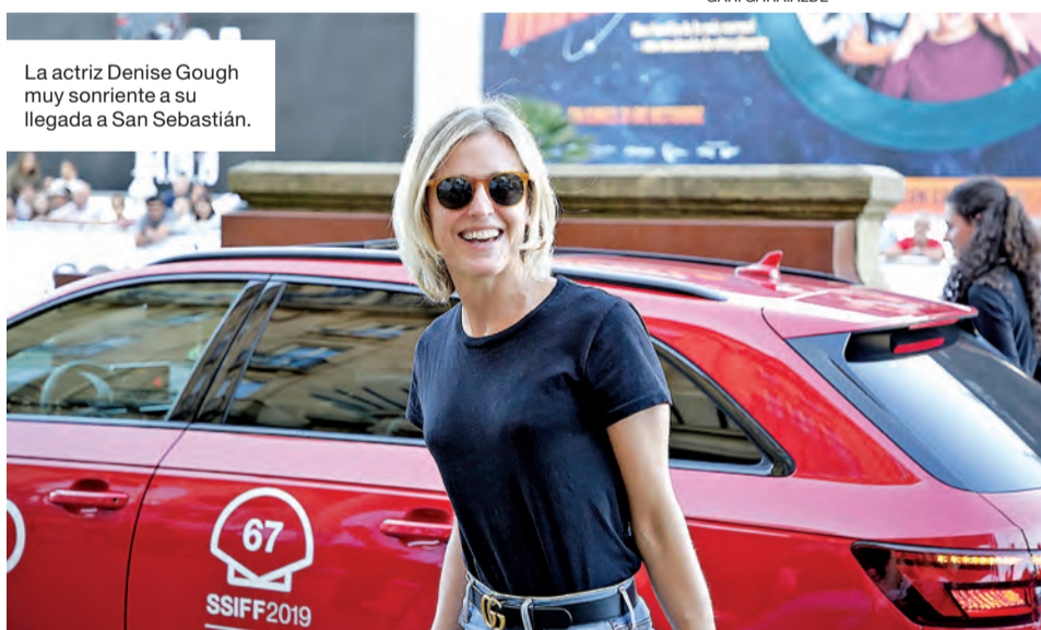
La actriz Denise Gough muy sonriente a su llegada a San Sebastián.