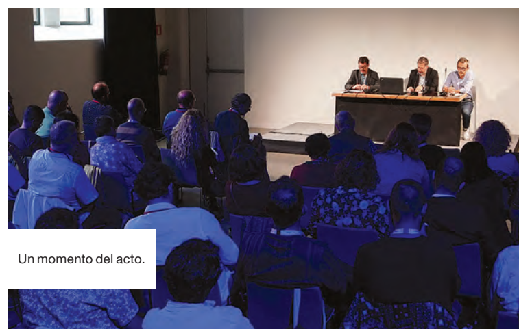
Un momento del acto.