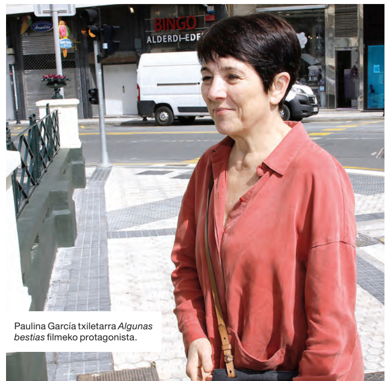
Paulina García txiletarra Algunas bestias filmeko protagonista.