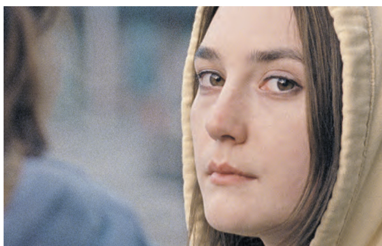
Never Rarely Sometimes Always.