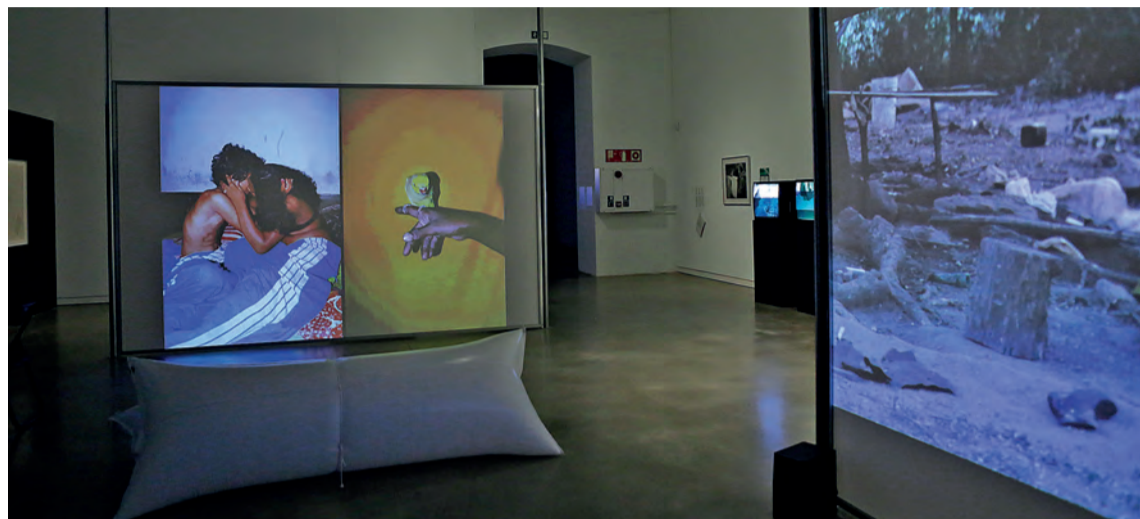
Erakusketak zur eta lur uzten du bisitaria, era askotako eragin bisualak nonahitik datozkiola.

Aretora sartzean, instalazio batek egiten du harrera; Discoteca Flaming