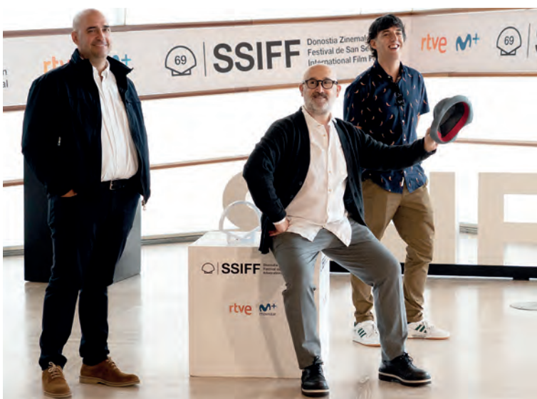
Javier Cámara vuelve a interpretar al político Juan Carrasco en "Venga Juan".