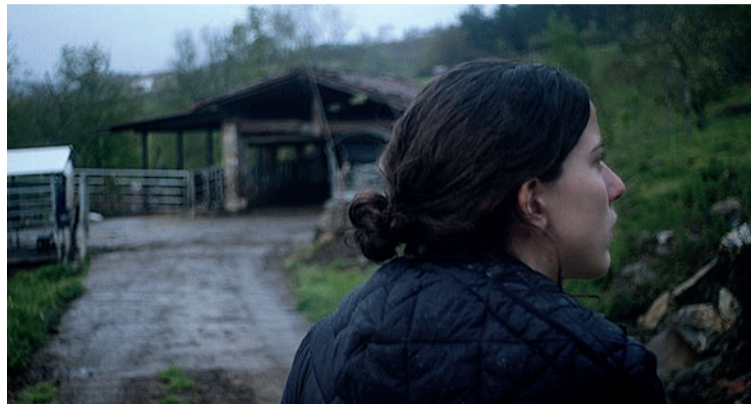
Imagen del cortometraje Erro Bi .