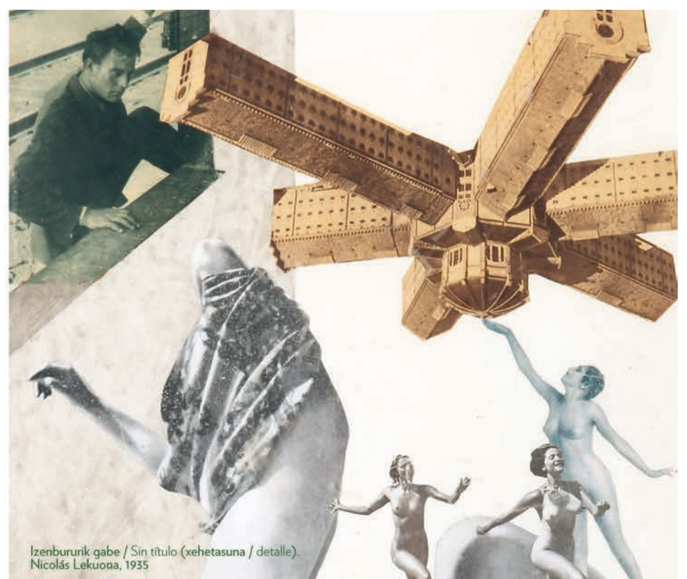
Izenbururik gabe / Sin título (xehetasuna / detalle). Nicolás Lekuona, 1935