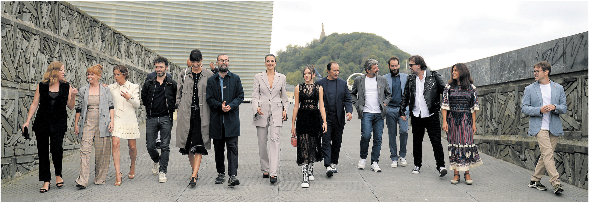
La representación de la serie Apagón en San Sebastián.