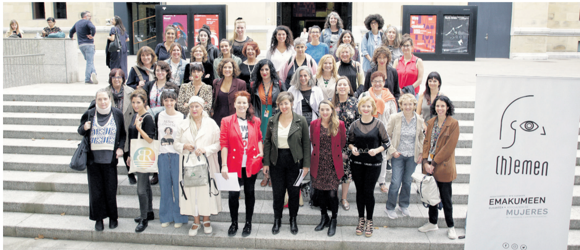
(H)EMEN eragileko talde argazkia.