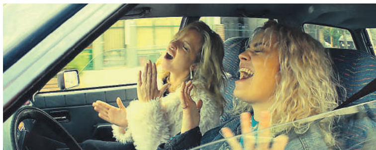
Ópera prima de Dolores Fonzi, Blondi .