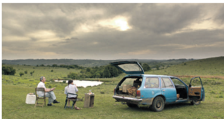
El viento que arrasa , de Paula Hernández.