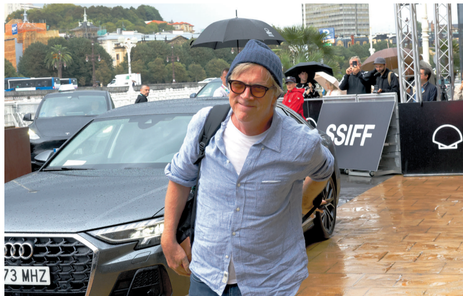
Todd Haynesek May December filma aurkeztuko du Perlak sailean.