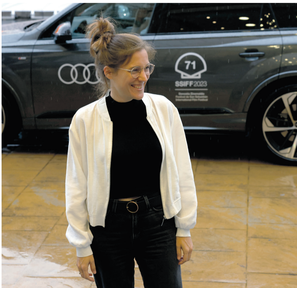
Carla Simón recogerá hoy el Premio Nacional de Cinematografía.