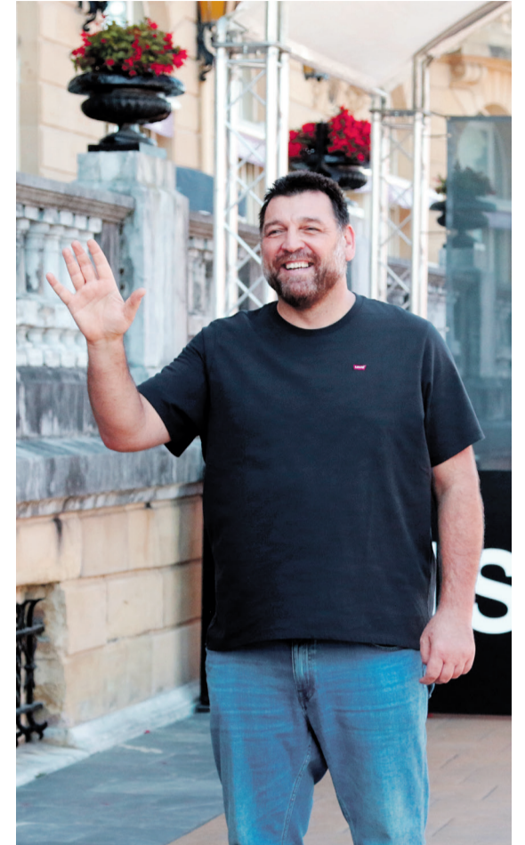
Hovik Keuchkerian, protagonista de Un amor , de Isabel Coixet.