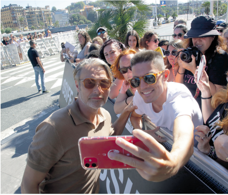
Mads Mikkelsen aktore danimarkarra bere jarraitzaileekin argazkiak ateratzen.