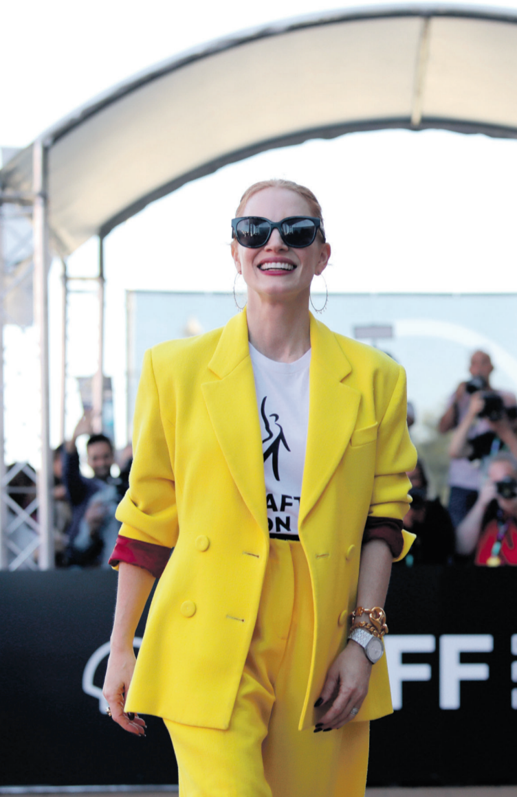
Jessica Chastain vuelve para presentar Memory en Perlak tras ganar la Concha de Plata hace dos años.